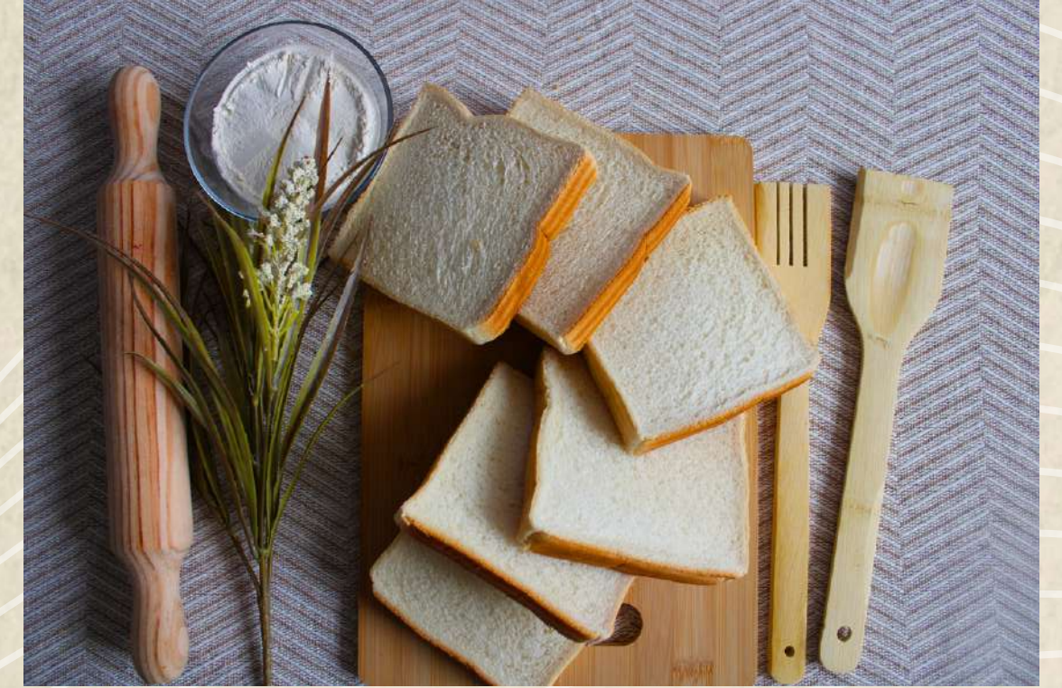
PAN MOLDE BLANCO SÁNDWICH COD. 2305