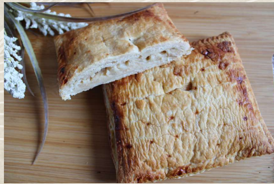
EMPANADILLA QUESO CABRA CON CEBOLLA CARMELIZADA