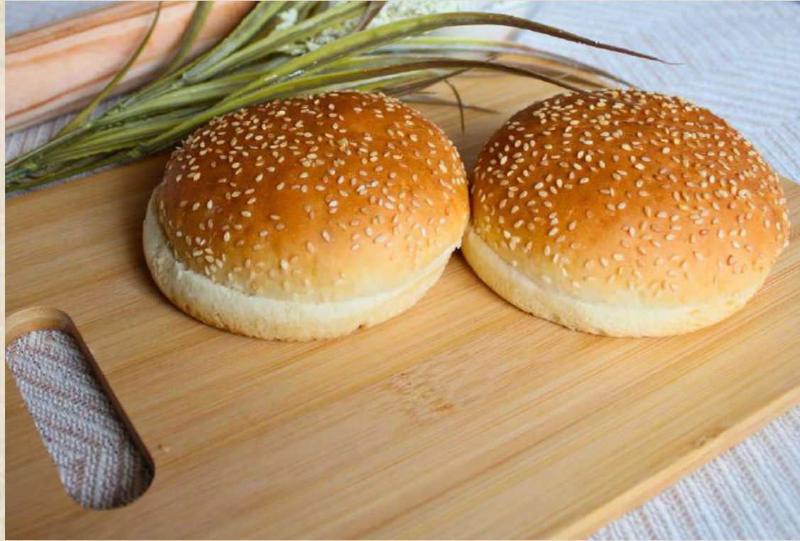
PAN HAMBURGUESA GRANDE (BOLSA. 4 UNIDADES) COD. 2307