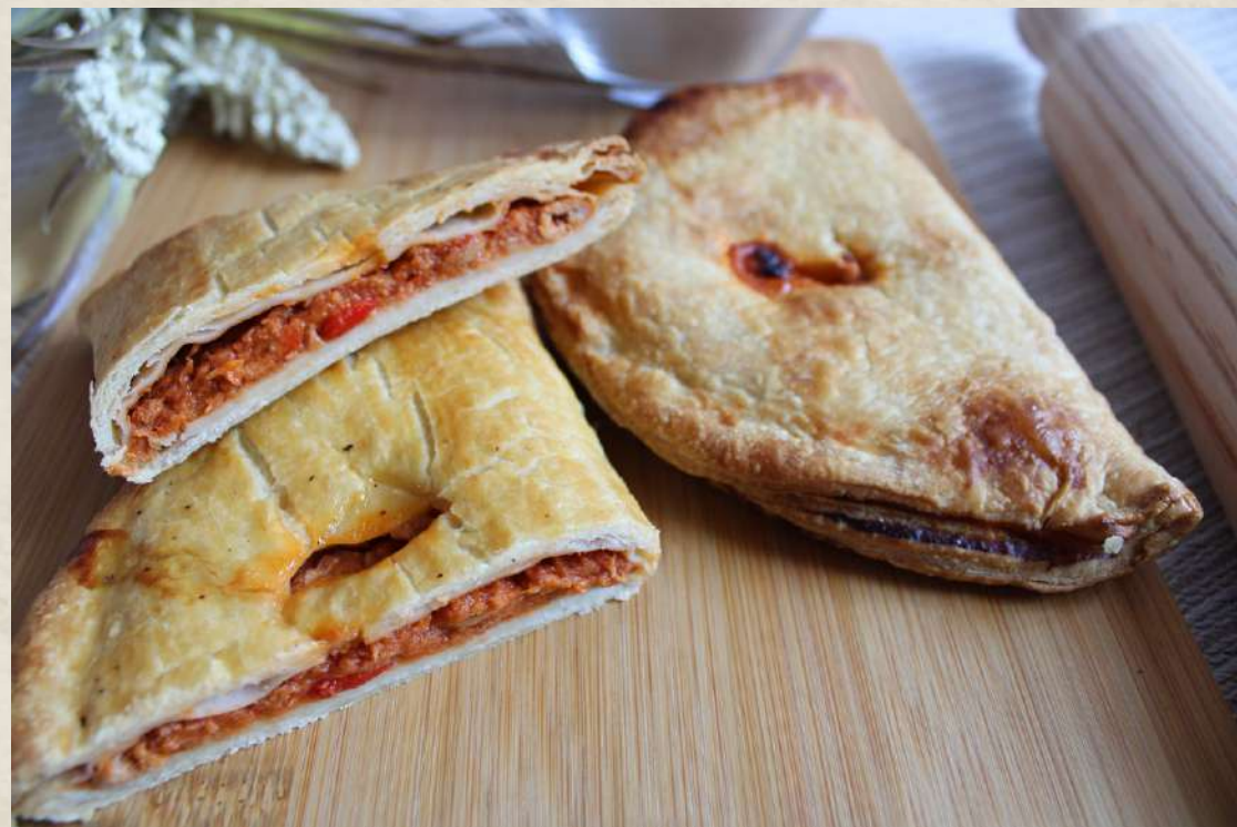
EMPANADILLA DE ATÚN CON TOMATE