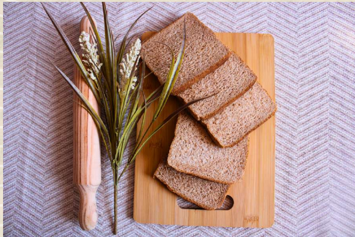
PAN MOLDE 100% INTEGRAL SÁNDWICH COD. 2306