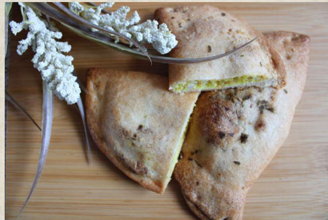
EMPANADILLA POLLO AL CURRY