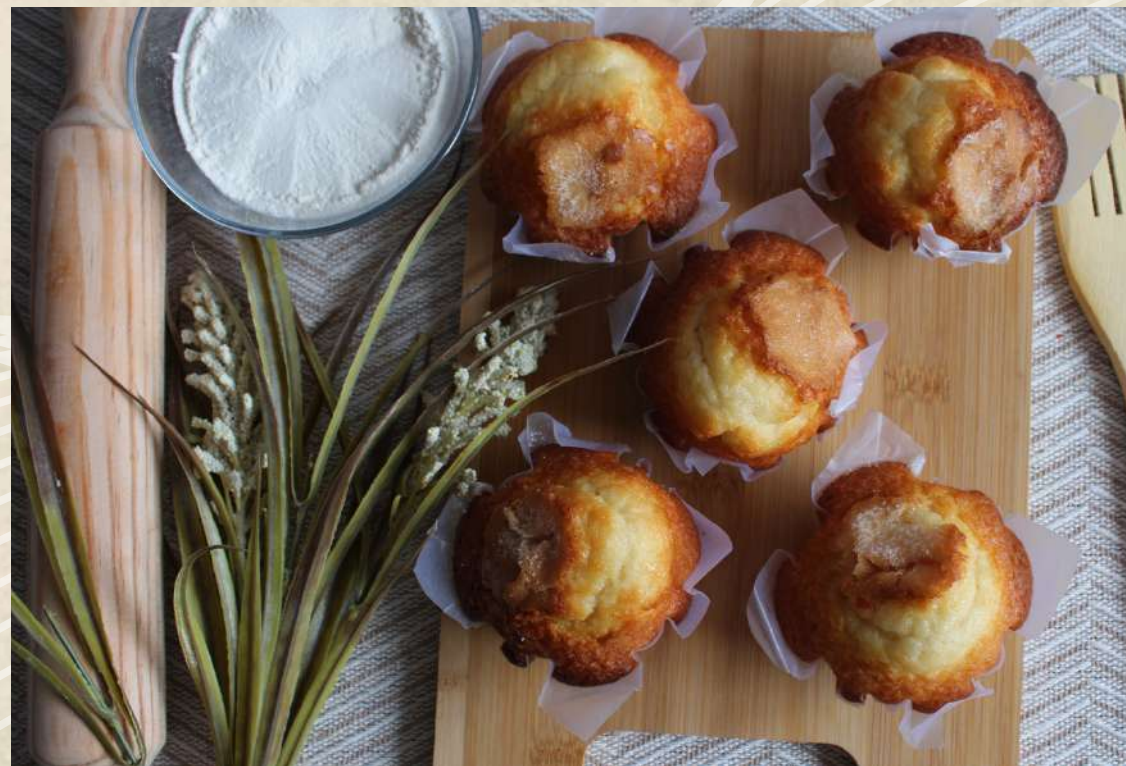
ESTUCHE MAGDALENAS 6 UD. COD. 2463