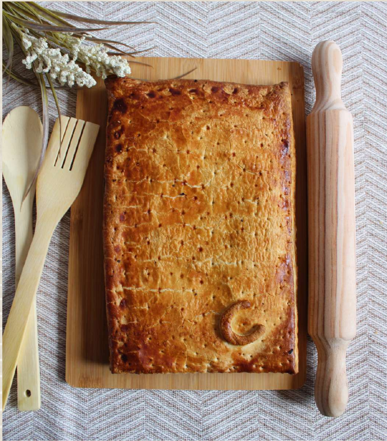
EMPANADA CARNE 600, 700 Y 1000 GR.