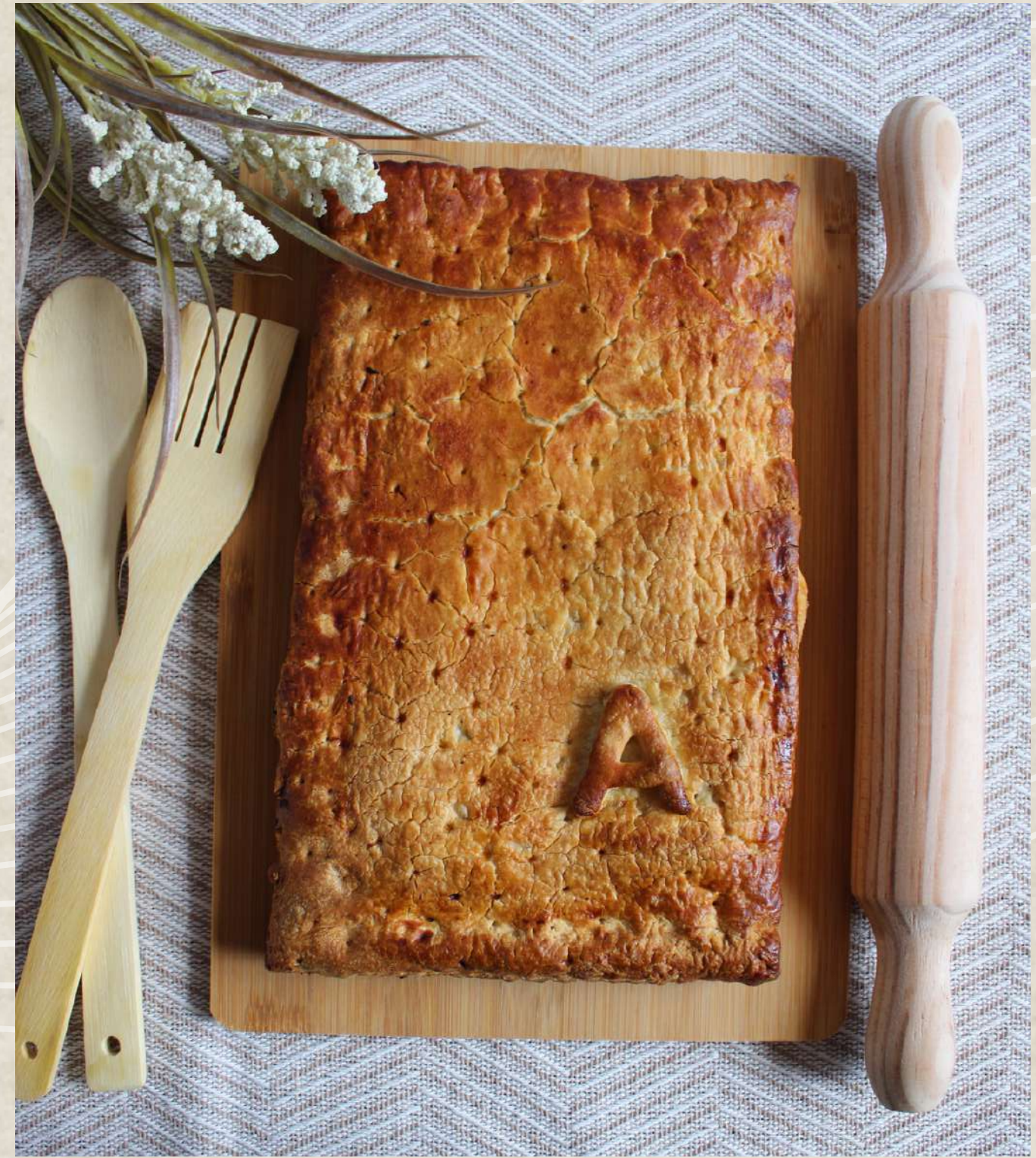
EMPANADA ATÚN 600, 700 Y 1000 GR.