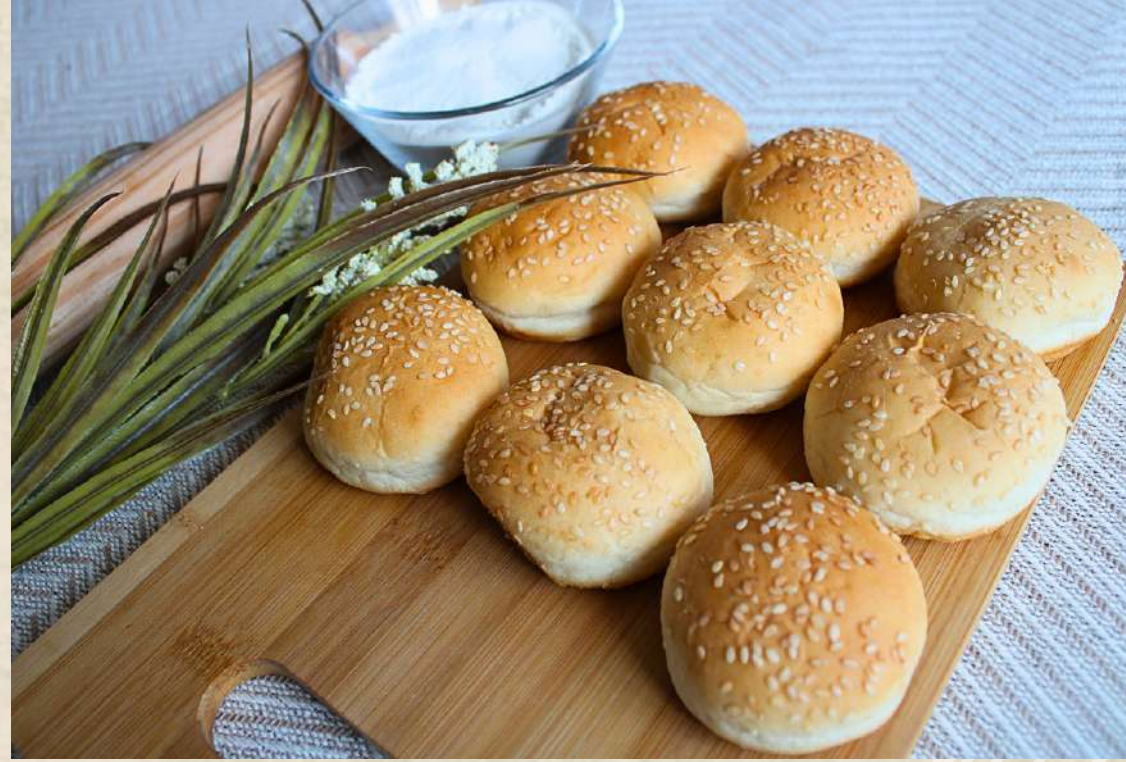
PAN DE HAMBURGUESA PEQUEÑA (BOLSA DE 12 UNIDADES) COD. 2310