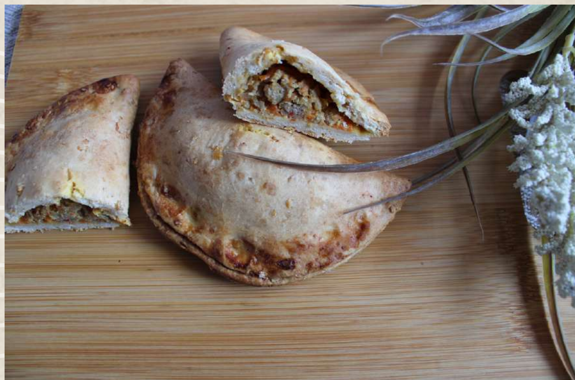
EMPANADILLA CARNE BARBACOA